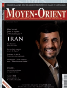
Moyen-Orient n°1 Dossier spécial Iran