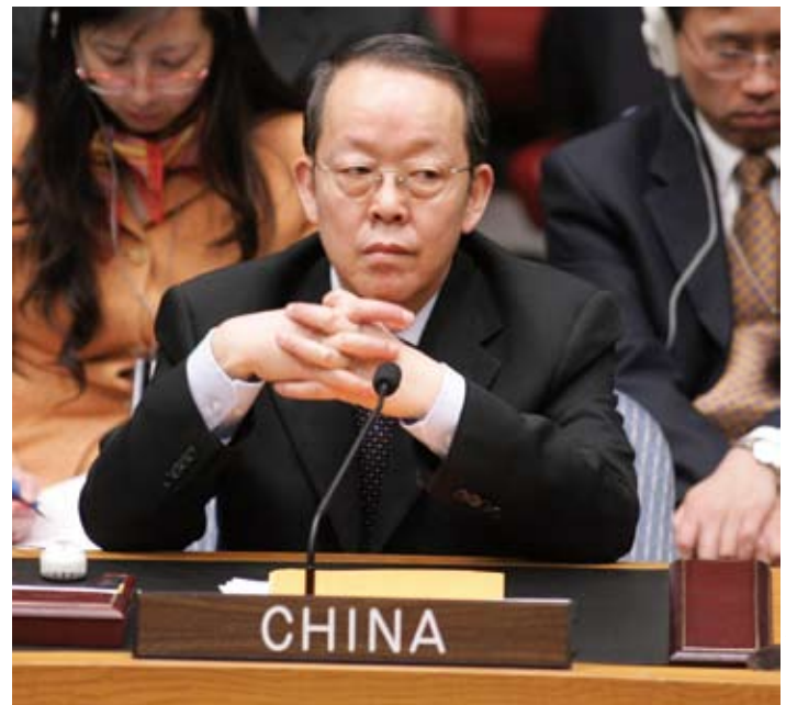
Conseil de sécurité des Nations unies, l'ambassadeur Wang Guangya.

Téléchargeable sur : http://www.crisisgroup.org/library/documents/asia/north_east_asia/b100_the_iran_nuclear_issue_the_view_from_beijing.pdf