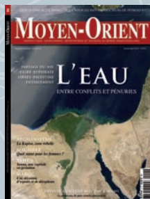
Moyen-Orient n°4 Dossier spécial sur l'eau

Dans vos kiosques et librairies début juin 2010 Moyen-Orient n°6 Dossier spécial «Chiisme»