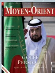
Moyen-Orient n°3 Dossier spécial Golfe