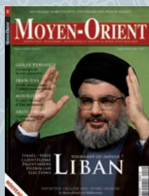
Moyen-Orient n°2 Dossier spécial Liban